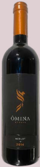
17 Ómina Romana Merlot 2016 Lazio 17,36 Punkte 25 Franken terravigna.ch