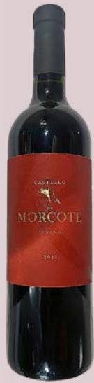
20 Castello di Morcote Merlot Ticino Riserva 2020 Tenuta Castello di Morcote, Morcote TI 17,32 Punkte 69 Franken castellodimorcote.ch

nur in Frankreich, auch in den USA. Weshalb die Auswahl nicht derart gross ist, wie man auf den ersten Blick meinen könnte. So liessen wir Weine ab einem Anteil von 85 Prozent Merlot für das Tasting zu. Das ist der Minimal-Prozentsatz, den es in der EU braucht, um einen Wein unter dem Label Merlot zu verkaufen. Im Tessin sind es 90 Prozent.