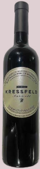
19 Vigna Kressfeld Merlot Riserva 2018 Tenuta Kornell, Südtirol 17,34 Punkte 64 Franken weinvogel.ch