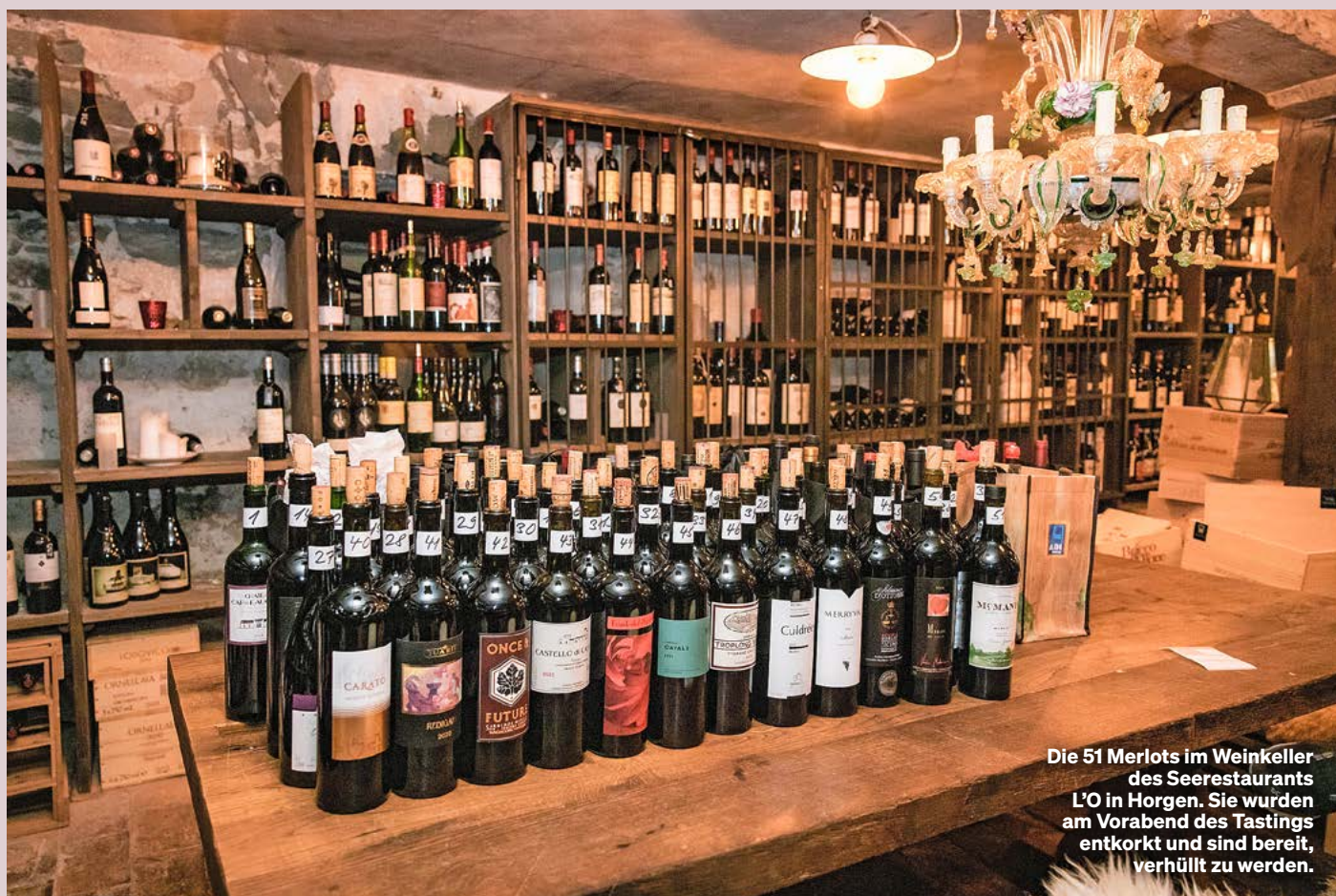
Die 51 Merlots im Weinkeller des Seerestaurants L'O in Horgen. Sie wurden am Vorabend des Tastings entkorkt und sind bereit, verhüllt zu werden.

Die Welt-Rebsorte Merlot ist dank des Tessins Schweizer Kulturgut. Doch sind helvetische Merlots auch Weltklasse? Die Antwort ist klar: Ja! Der Preis-Leistungs-Sieger aber kommt aus Bordeaux.