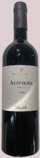
17 Antenata Merlot 2020 Tenuta Vallocaia, Toscana 17,36 Punkte 49 Franken bindella.ch